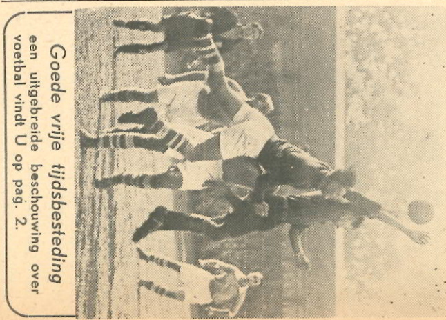
Goede vrije tijdsbesteding een uitgebreide beschouwing over voetbal vindt U op pag. 2.

Er wordt dus propaganda gemaakt voor de tbc-bestrijding en VDH doet daaraan mee, niet alleen door het inrichten van onze etalage aan de Parkweg, doch vooral door de vertoning van de prachtige film „Wit wint“, Hoewel deze film in de eerste plaats